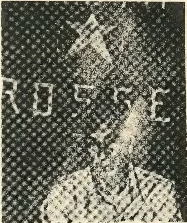
Η φωτογραφία του άπαχθέντος Άλντο

ζουν. Στην καταπίεση, στην εκμετάλλευση του ανθρώπου απο τον άνθρωπο, στην επιβολή «δημοκρατικών» μέσων ζωής.